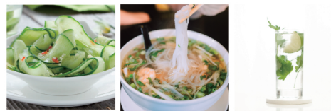
キュウリのサラダ ベトナムフォー ジントニック